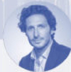
Adrien Nussenbaum Co-founder and CEO Mirakl Inc.

Mirakl is a French cloud-based e-commerce software company headquartered in Paris, France. Created in 2011, Mirakl raised $300 million at a $1.5 billion valuation in September 2020, thus becoming one of the most prominent French unicorns.